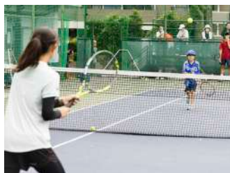
テニス教室 (硬式) 【庭球部】