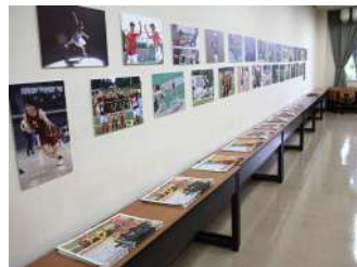
早稲田スポーツ写真展 【早稲田スポーツ新聞会】