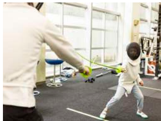
初めてのフェンシング体験! 【フェンシング部】