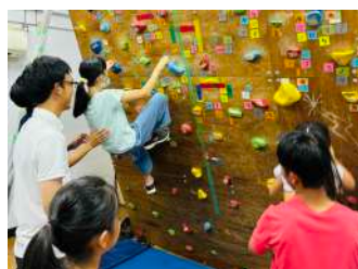
ボルダリング体験 【山岳部】