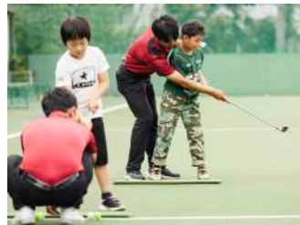
チャレンジ! ゴルフ体験! 【ゴルフ部】