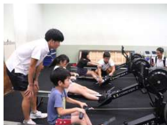
わくわく！ ボート体験 【漕艇部】