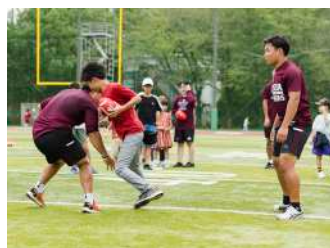
①フラッグフットボール体験 ／②アメリカンフットボール体験 【米式蹴球部】