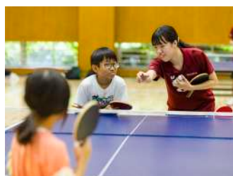
一本集中！ 卓球体験！ 【卓球部】