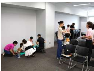
①親子で歩育! ~みんなで歩き方名人 に~/②あるこで街なかウォーキング 【西東京市様】