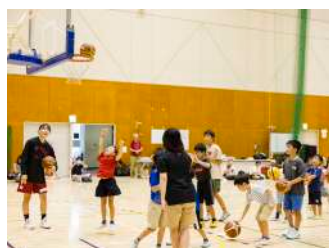
ステップ！ジャンプ！ シュート！ 【バスケットボール部】