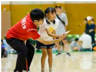
はじめてのバドミントン体験! 【バドミントン部】