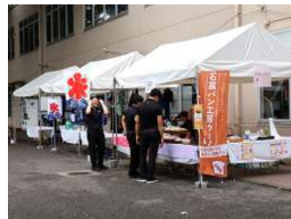
【エドナ様、ウーノ様、 鯛焼きのよしかわ様】