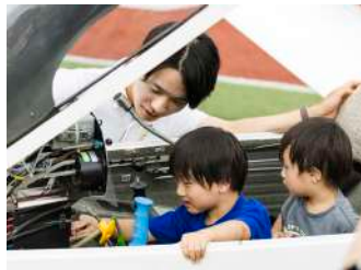
①今日から君もパイロット! グライダー搭 乗体験/②フライトシミュレーター体験 【航空部】