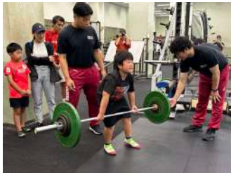
重力に逆らえ! ウエイトリフティング教室 【ウエイトリフティング部】