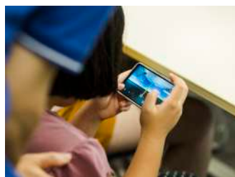
バーチャルヨットレース 【ヨット部】