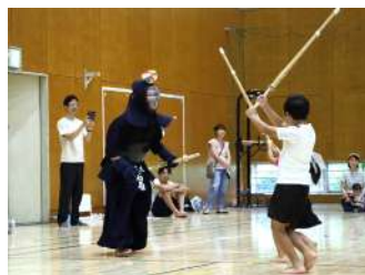
Let's 剣道 ～君も今日から剣士だ！～ 【剣道部】