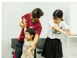
みんなで楽しく 陸上トレーニング体験！！ 【水泳部】