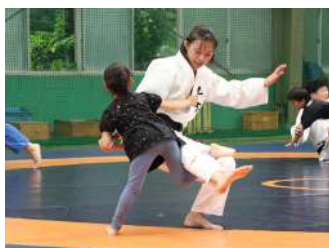
柔道体験教室！ 君も強くなろう！ 【柔道部】