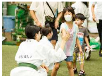
突き蹴りなんでもオッケー! 少林寺拳法! 【少林寺拳法部】