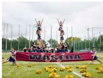
応援ステージ 【応援部/Teddy Bears】