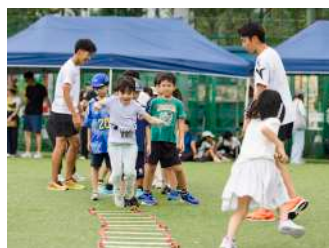
ちびっこリレー 【競走部】