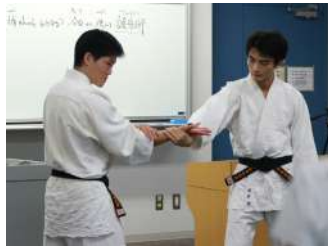
不審者に捕まれたらどうする? 合気道体験! 【合気道部】