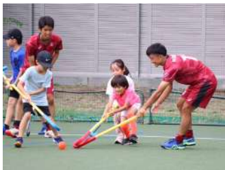
ウキウキ! ホッケー体験 【ホッケー部】