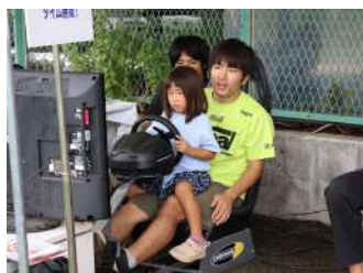
自動車部員とタイム勝負！ 【自動車部】