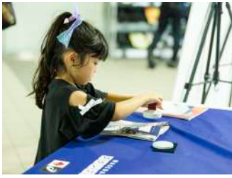
スタンプラリー 【アシックスジャパン株式会社様】