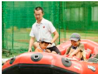
①テント設営体験/②30キロザック 背負い体験!/③ポート空気入れ体験 【ワンダーフォーゲル部】