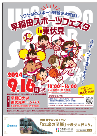
▲ ポスター (B1: 734×1,036mm)