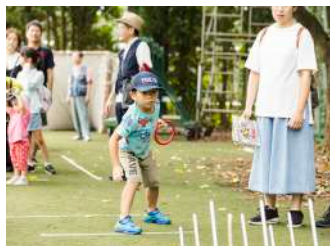
輪投げ 【西東京稲門会様】