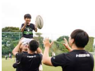
レッツ エンジョイ ラグビー！ 【ラグビー蹴球部】