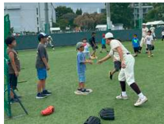
みんなであそぼう! ベースボール5! 【準硬式野球部】