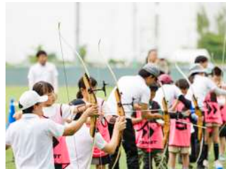
アーチェリー体験 【アーチェリー部】