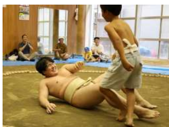
①どすこい！相撲教室 ／②ちゃんこ会 【相撲部】