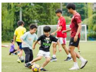
わくわく！ サッカー教室！ 【ア式蹴球部】