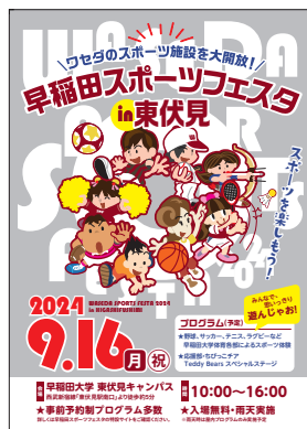
▲ チラシ (A4: 210×297mm)