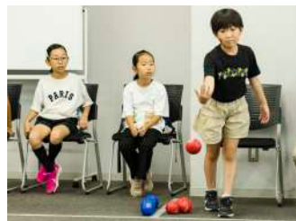
ボッチャ体験しよう! 【ココスポ東伏見様】