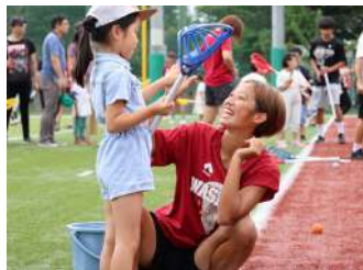
ショットを打とう! ラクロス体験 【ラクロス部】