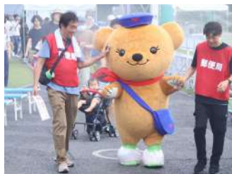
ぼすくまとの写真撮影 【保谷東伏見郵便局様】