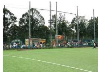
【リコリコキッチン様、ループ様、 1016TOiRo COFFEE様】