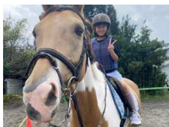
馬とふれあう！ ①ジュニア乗馬体験／②餌やり体験 【馬術部】