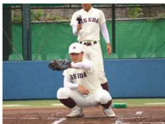
打って投げて！ 野球計測体験！ 【野球部】