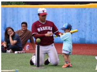
誰でもかんたん! みんなでやろうティーボール教室 【ソフトボール部】