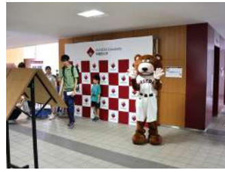
インタビューバックで 記念撮影!