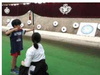
わくわく！弓道体験！ 【弓道部】