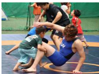
目指せオリンピック！ レスリング教室 【レスリング部】