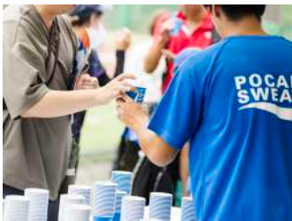
【大塚製薬株式会社様】